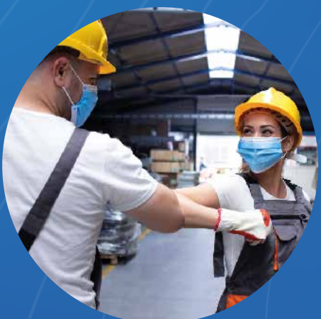
SEGURIDAD Y SALUD EN EL TRABAJO